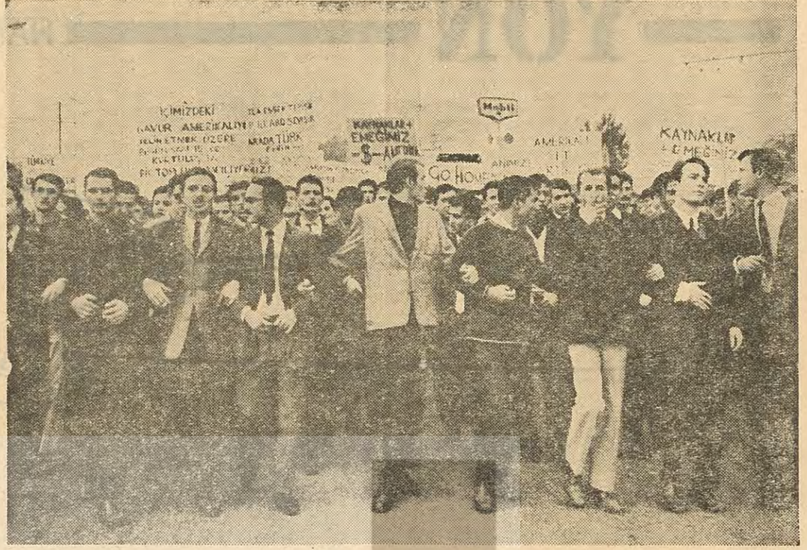
Ankara olaylarından bir görünüş «At altında tay aramayalım!..»

Başbakan Demirel'in unutulmaz konuşmaları sayesinde, AP'lisi, CHP'lisi, tüccarı, işçisi, esnafı, köylüsü bütün millet, durup dururken «ihtilâl mi geliyor» diye meraklanmışlardır. Halbuki Türkiye, şimdilik bir ihtilâl ortamı içinde bulunmaktan çok uzaktır. Muhalefet lideri İnönü, şaşırtacak ölçüde yumuşak konuşmalar yapmaktadır. Bu na rağmen, Demirel, hırçın sinirli ve vehimlidir. Boyuna ihtilâlden söz etmektedir. Durum o kadar gariptir ki, bir milletvekili, aydınlanmak için CHP grubunda İsmet Paşaya «ihtilâl lâflarının neye de lâlet ettiğini» sormak zorunda kalmıştır. İnönü, «Bu konuşmaların bir şey anlamıyorum» cevabını vermiştir. Sanırız ki Demirel'in ihtilâl lâflarının en doğru değerlendirmesi budur. İhtimal ki, yüksek kademelerdeki bir takım tartışmalar ve bazı raporların çok mübalâgalı yorumlanması, Demirel'in sinirlerini bozmuştur. Bir ihtilâl ortamı olmadan, ihtilâl olmayacağı aşîkârdır. Henüz Türkiye böyle bir ortamda değildir. Nitekim CHP'nin 41 yaşındaki Genel Sekreteri Bülent Ecevit, 41 yaşındaki Başbakanı, İstanbul konuşmasında bu gerçeği hatırlatmıştır: «AP Genel Başkanı Demirel, gündür bir ihtilâl vehminin içinde görünüyor. İhtilâl her zaman ve her durumda ortaya çıkmaz. Sebepsiz yere ihtilâl beklenebilir».