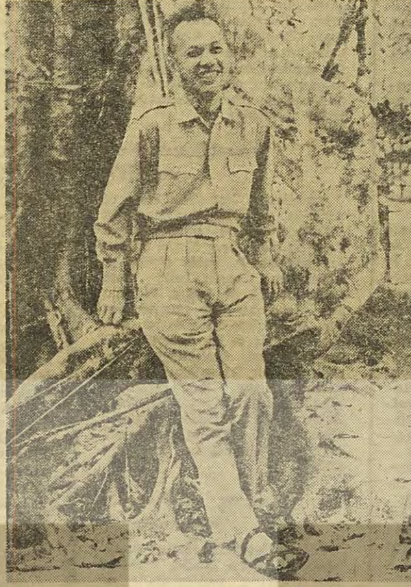
NGUYEN HUU - THO Olayların pişirdiği milliyetçi

Satılık rejim, köylüleri kazanabilmesini bilseydi, eski mukavemetçilerin yeniden harekete geçmesini belki başarısız kılabilirdi. Ama rejimin ilk işlerinden biri, 1954'den önce Viet-Minh'in kurtarılan bölgelerde girdiği toprak reformunu bozma oldu. Harp sırasında, kendileri büyük şehirlerde ve Avrupa'da yaşayıp kira geliriyle geçinen büyük arazi sahiplerinin toprakları fakir köylülere dağıtılmıştı. Arazileri başında kalan ve Fransızlarla işbirliği yapmayan toprak sahiplerinin ise arazilerine dokunulmamış, yalnız köylülerden aldıkları kira bedeli azaltılmış ve eski borçlar silinmişti. Ama satılık hükümet, Amerikalı toprak reformu müşaviri Ladejinsky ile birlikte, bir «toprakları geri alma plânı» sahneye koymuştur. Top-